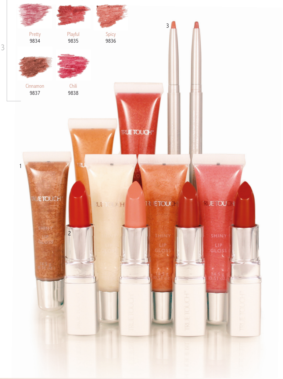
Precision Lip Liner, 0.23g