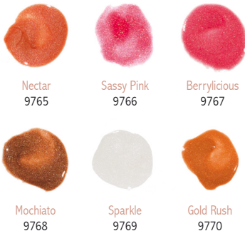
Shiny Lip Gloss, 14.5g